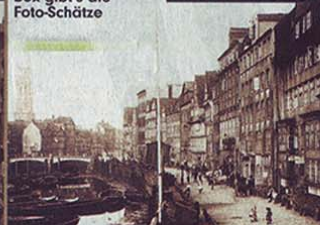
Der Blick auf Katharinenkirche und Brooksbrücke 1884. Damals war die heutige Speicherstadt (Baustart 1883) noch ein dicht besiedeltes Wohnquartier