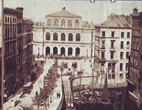
Blick im Jahr 1860 auf die Börse. Rechts steht heute die Haspa-Zentrale. Wo der Fleet abbiegt, rollt heute die U3 in den Untergrund