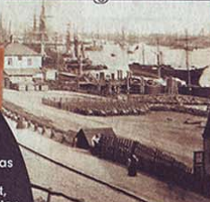
Kaum wiederzuerkennen: Der damalige Landungsplatz der Dampfschiffe im Jahr 1868. Links geht es hoch zum Stintfang