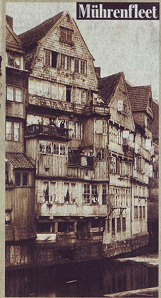
▲ Wohnhäuser am heutigen Zollkanal, von der Brooksbrücke aus fotografiert. Das Bild entstand 1884